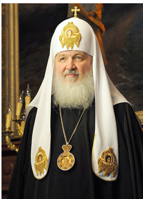
Святейший патриарх Московский и всея Руси Кирилл

Способность человека видеть свои прегрешения — великая добродетель в очах Божиих, и, напротив, отсутствие этого качества, а также недостаток самокритичности и покаянного чувства являются греховным повреждением души человеческой. ►