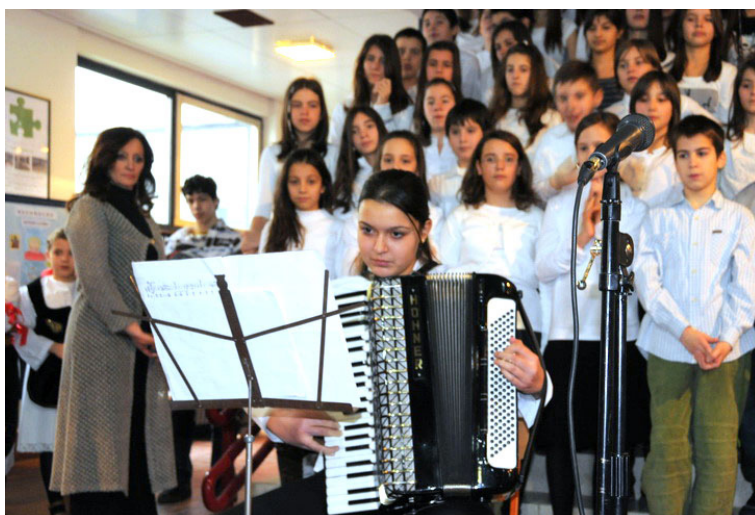
Школьный концерт в честь святителя

Сегодня, по прошествии стольких веков после смерти святого Саввы, сербы, обремененные многими бедами и проблемами, с радостью готовятся прославить своего молитвенника перед Господом.