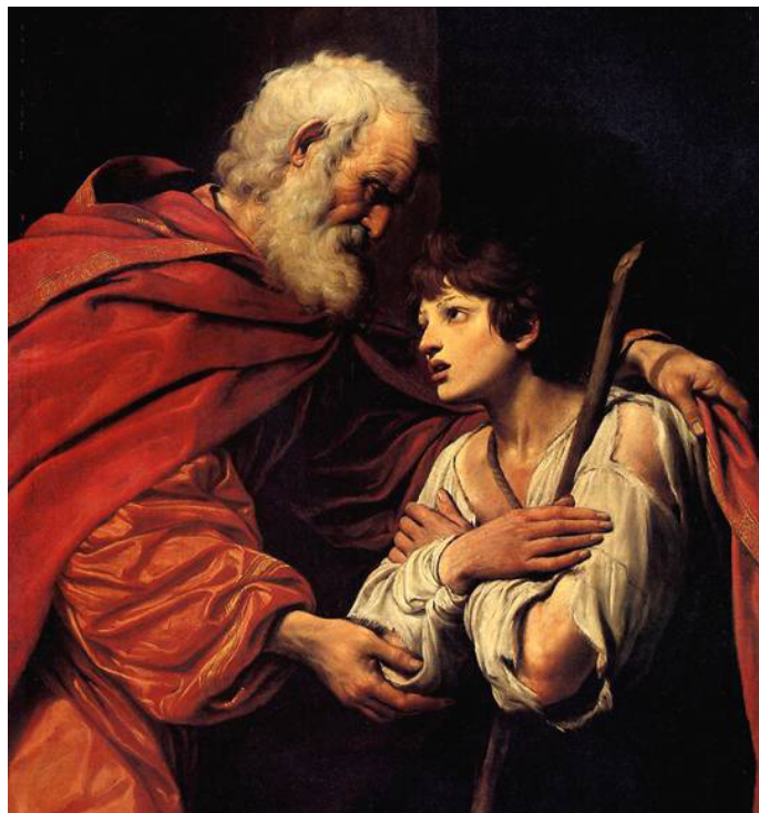
Спада Лионелло. Возвращение блудного сына. Болонья, 1576 — Парма, 1622

Единственной памятью о Родине у них остались музыкальные инструменты, которые для завоевателей не имели никакой ценности. Бережно сохраняя от влаги и повреждений свои кинноры (простейшая арфа с несколькими струнами из жил животных, традиционная у евреев), они не положили их на землю, а аккуратно повесили на ветки деревьев. Все они расстроены, многие плачут. Причиной тому недавний случай. Вавилонские конвоиры, сопровождая иудеев, видимо, на какие-то работы, обратились к ним с, в общем-то, безобидной просьбой: спеть что-то из их народных песен, чтобы веселее было идти. Они не могли предположить, какую бурю эмоций вызовет у пленников это предложение. Но народные песни иудеев были тесно связаны с верой в Бога и Богослужением.