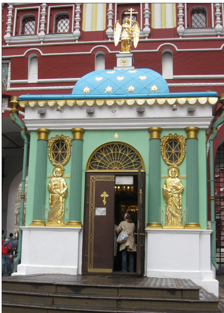
Иверская часовня у Воскресенских ворот в Москве.

Дерзость ненавидящих образ Господень/ и держава нечестивых безбожно в Nikeю прииде,/ и посланнии безчеловечно вдовицу,/ благочестно чтущую икону Богоматере, истязуют,/ но тая нощию с сыном икону в море пусти, вопиющи:/ слава Тебе, Чистая,/ яко непроходимое море плещи своя подаде,// слава правошествию Твоему, едина Нетленная.