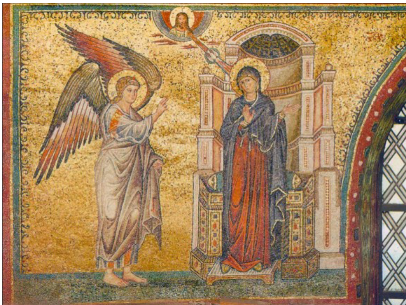
Фото: Благовещение. Мозаика храма Санта-Мария-Маджоре. 1295 г.