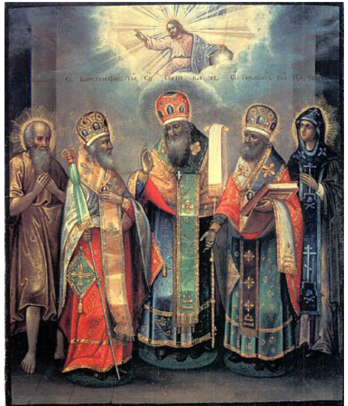
Преподобный Павел Препростый, Варсонофий еп. Тверской, Гурий и Герман, архиеп. Казанские, прп. Евдокия

Обретение мощей святителя Гурия, архиепископа Казанского (+ 1563), и Варсонофия, епископа Тверского (+ 1576), произошло в Казани, в 1595 году. При строительстве новой каменной церкви в честь Преображения Господня в Спасо-Преображенском монастыре, основанном святителем Варсонофием, у алтарной стены прежнего деревянного храма были выкопаны гробы с телами святителей. Необычность вида нетленных гробов исполнила святителя Ермогена (память 17 февраля) благоговейным дерзновением открыть гробы при большом стечении народа. Сам святитель Ермоген так описывает это событие: «Видехом диво, его же не надеяхомся. Рака бо святаго бе полна благоуханна мира, как чистой воды, мощи же святаго Гурия вверху мира, яко губа ношахуся. Нетлением бо одари Бог честное и многотрудное его тело, яко и ныне зрится всеми. Токмо мало верхняя губы тление коснуса, прочие же его уды целы быша, ничем же невредимы. Осязахом же и погребальные ризы его и бяху крепки зело. Потом же открыхом раку преподобнаго Варсонофия и видехом: многим нетлением почтени от Бога мощи святаго Варсонофия. К ногам преподобнаго тление коснуса, но обаче не токмо кости не разрушены, но крепки бяху зело и никакоже слабости в составе имуща,